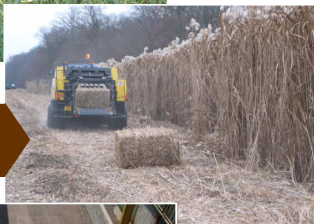
Récolte de miscanthus en balle (mars)