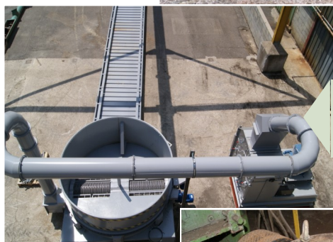
Déchiqueur de bottes de miscanthus