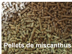
Pellets de miscanthus