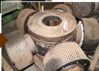
Filière à pellets