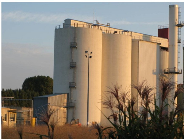
Silos de stockage de Bourgogne Pellets