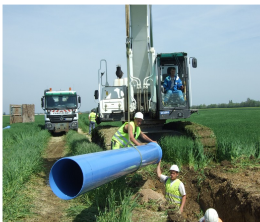
Pose des canalisations le 29 avril 2010