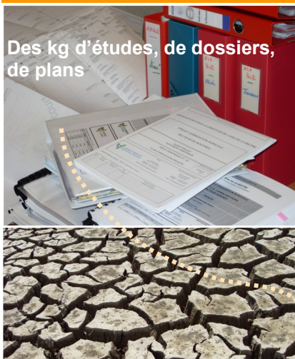
Des kg d'études, de dossiers, de plans