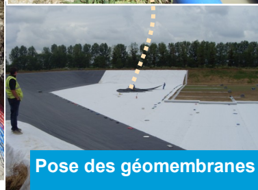
Pose des géomembranes