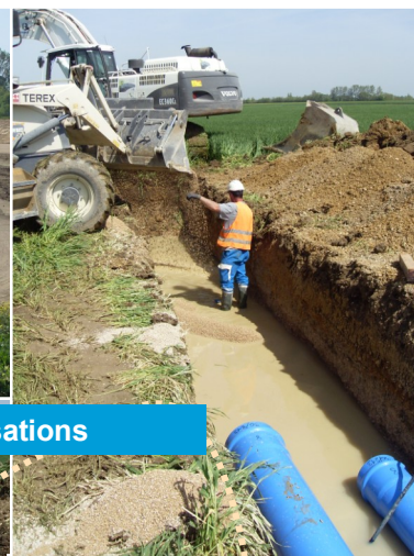
Pose des canalisations