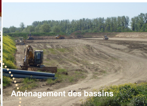
Aménagement des bassins