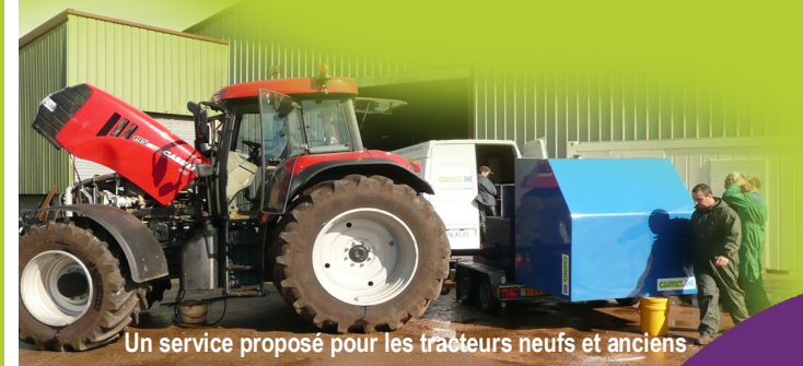
Un service proposé pour les tracteurs neufs et anciens

.....► Connaître mon moteur pour diminuer ma consommation